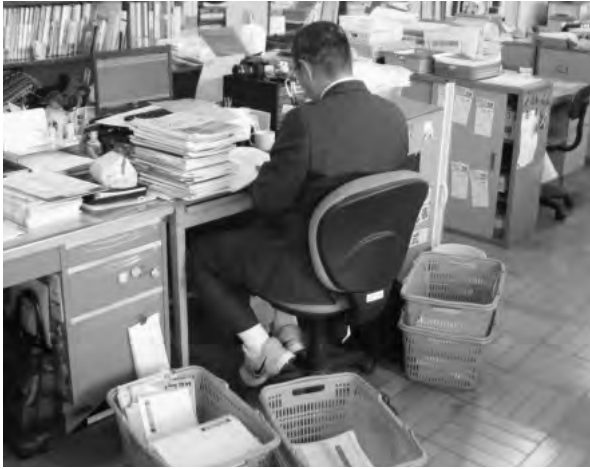
写真1 机に積まれた「ヒトベンノート」をチェックする教員。ノートは係の生徒がまとめてカゴに入れ、その日の担当教員に持参する

トベンノート」のチェックを学年団以外にも広げ、学級担任の負担を減らすという目的もあった。特に、月曜は生活記録ノートが週末3日分にもなるため、「ヒトベンノート」は学級担任以外で見られるようにしている。