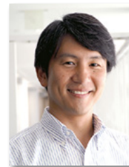
学校教育部指導課 指導主事

まず、玉川大学に委託して、高学年向けを基に中学年向けのカリキュラムを2016年に開発。2学期に英語教育推進リーダーによる検証授業を6回行い、修正した上で全校に配布し、