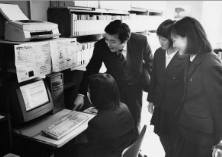
進路指導室に3台、図書館に3台置かれたパソコンは、インターネットに接続できるようになっており、生徒が自由に使用できる。大学のホームページを見る生徒も多い。

手法を踏襲し、山形北高校でも生徒自身に取材相手に電話をさせ、アポイントを取らせた。