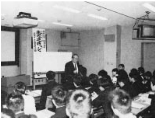
「ジョイントセミナー」では、九州大の教授を招いて、城南高生の前で専門分野に関する基礎的な講義をしてもらい、実験室や研究室を見学する研究室訪問も行った。