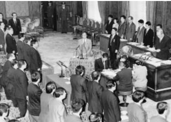
'93年、国会に証人として喚問されたテレビ朝日の報道局長。

支持する政党を持たない有権者のこと。新聞社などの調査によると、年々増加傾向にあり、大都市圏で60%、地方で30~40%に及ぶといわれている。無党派層の中には、政治状況の変化に応じて投票行動を変えざる意識の高い人もいるが、一般には政治に関心が薄い人が多く、投票率低下の原因といわれている。しかし、なんらかの要因で無党派層が動く大きな勢力となり、選挙結果に影響を及ぼすことになる。