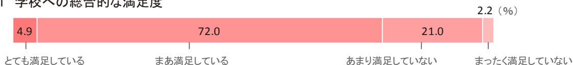
図12-1 学校への総合的な満足度

Q お子さまが通われている小学校にどのような教育や指導などを期待していますか。今年度1学期の学校の教育や指導などに、どれくらい満足していますか。