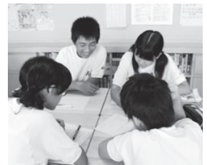
リンキンボムの様子