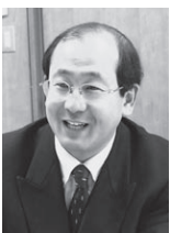
天理市立北中学校

こうして同校では、3年間を通して、「学習意欲」「学力」「学ぶ目的」と三つの力を備えた生徒を育てようとしている。