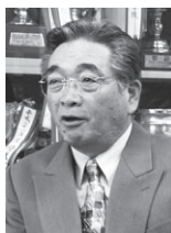
天理市立北中学校校長

研究主任。2学年担当。国語科担当。「生徒一人ひとりの存在を、輝かせることが出来る教師でありたい」