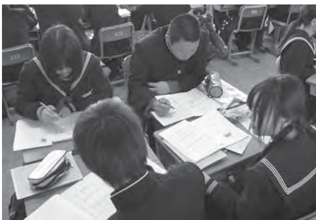
写真2 クラス全員の前では声が出せない生徒も、グループ学習では積極的に発言することが多い。1年間、共に学習を続ける中で、出来ない生徒をフォローしようとする意識も芽生えてくる

「授業が分かりやすい」と答えた生徒は9割に上りますが、実際に理解している生徒となると、数値はぐっと下がります。授業で分かったけれども、家に帰ったら忘れてしまう生徒は少なくありません。授業で分かったことを家で繰り返し解いてみることで、学習内容はより定着します。家庭学習の重要性を生徒に伝え続けると共に、家庭学習に取り組みやすくするために、より分かりやすい授業を心掛けていく必要性を感じます」（深田先生）