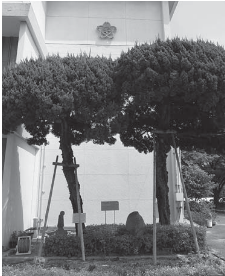
写真 校内にはイチヨウやカイヅカイブキなどの「被爆樹木」が多数ある。戦後、地域の協力を得て、校区内にある被爆樹木を移植した。同校は市内有数の緑豊かな学校となっている