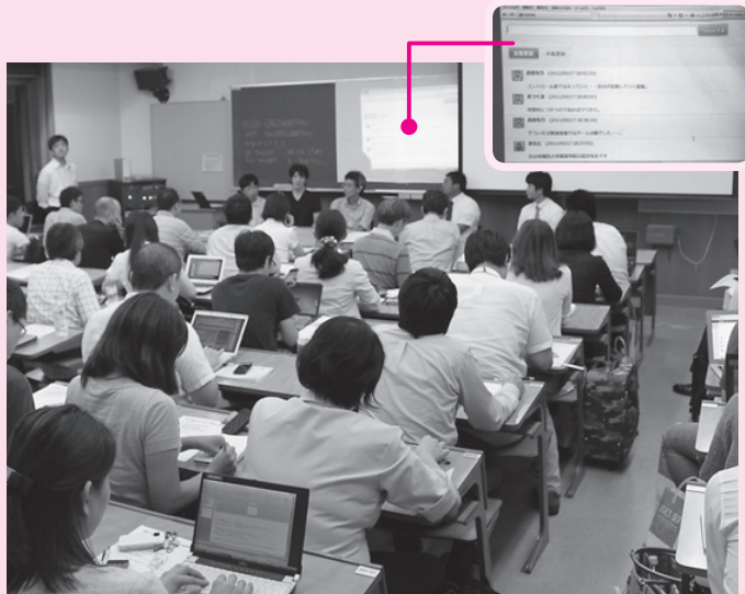
写真 研究者や学校関係者など80人近くが参加。実際に参加者がゲームをしながらゲームニクスを体験したり、参加者がパソコンなどからつぶやいた質問や感想がリアルタイムに前面のプロジェクターに映し出されたりと、双方向のコミュニケーションを楽しみながら進化した