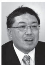
学事部教務総合事務室 事務長

「環境問題に見られるように社会問題は複雑化し、学際的なアプローチが必要とされています。従来の縦割