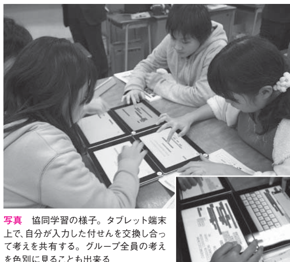
写真 協同学習の様子。タブレット端末上で、自分が入力した付せんを交換し合っ て考えを共有する。グループ全員の考え を色別に見ることも出来る