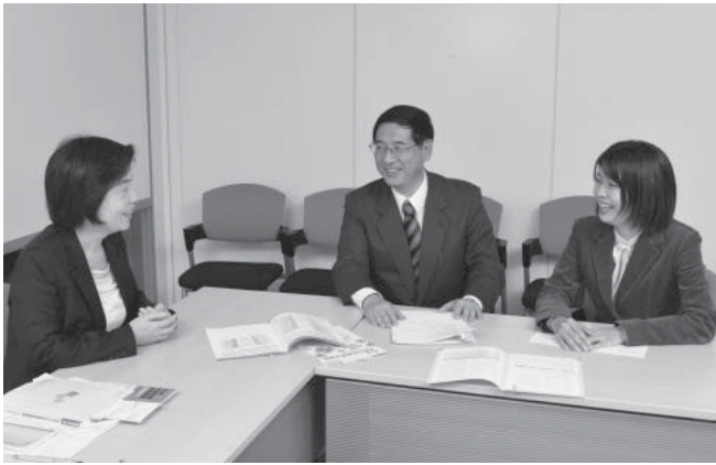
主体性を育むためには、一見遠回りでも豊かな感性を養うこと、そして、面白い授業を工夫していくことが大切だという意見が交わされた

順位を取る」「相手チームに勝利する」といった他者との比較を前提とした目標です。一方、熟達目標は「九九を覚える」「二段跳びが出来るようになる」など、具体的な行動や技能の向上を目標とします。遂行目標はどれだけ頑張っても相手が上回っていれば達成できませんが、熟達目標は自分の努力次第で達成できるため、取るべき行動が明確で、意欲が低下しづらいという特性があります。先を見通せるようになる高学年では、大きな目標と近い目標を持たせることも効果的です。将来を見つめ、そのために今の自分に出来ることを考えるようにするとよいでしょう。