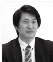
医療健康学部講師

金沢大学大学院医学系研究科博士後期課程修了。博士（保健学）。富山市民病院勤務を経て、2008年から現職。