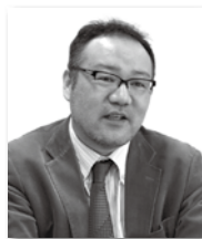
医療健康学部長補佐、 教授

「学校長推薦入試の志願者は、推薦基準に達している、医療系の資格が取れるといった理由で受験し、理学療法士がどういう職業なのかを十分理解せずに入ってしまう学生が目