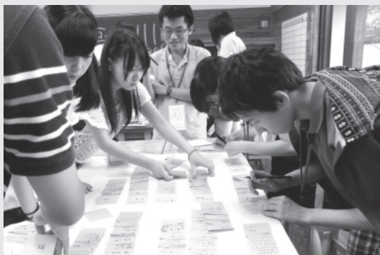
東京大イノベーション・サマープログラム (TISP) での様子 東京大の学生と共に、遠野の魅力や可能性を整理、発表した。

外部機関と連携する魅力は、私たち教師が思いつかないような広がりや進路学習にもたらしてくれる点にあると思います。大学教員や大学生、社会人、行政機関の職員など、様々な立場の人と共に体験活動をしていく中で、生徒は地域の課題を実感したり、調査・研究の面白さ、働くことの大変さに気付いたりします。教師の限られた知識と体験だけでは、伝え切れない示唆を与えることが可能だと思います。本校は、私にとって4校目の赴任校となりますが、今振り返ると、どの学校でもこのような取り組みは出来たのではないかと思います。大切なのは、学校外にある機会に、教師が気付けるかどうかです。まずは、学校外とのつながりをつくること。そして、外部から声を掛けられたら、門戸を閉ざさず、「生徒のためになるなら」と前向きに導入を検討する。少し学校の外に目を向けてみるだけで、教育活動の新たな可能性が広がっていくと思います。