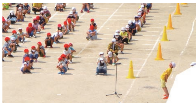
写真2 運動会は、人と人との距離を保つ目印となるよう、校庭に2メートル間隔に白線を引いて実施した。