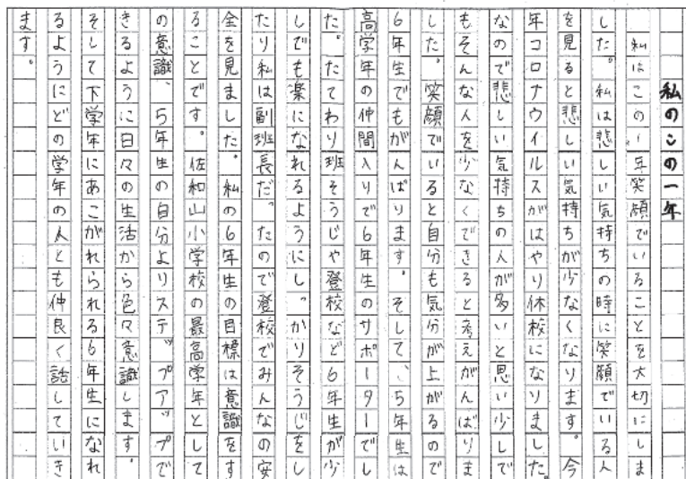
図2 5年生が書いた作文「私のこの一年」

2020年度の1年間を振り返る作文には、5年生の立場で心がけてきたこと、そして6年生になった時の目標がつけられている。