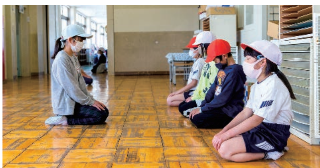
写真1 1～6年生の縦割り班で行う掃除では、まず黙想して心を落ち着かせる。そして、リーダーの6年生が今日のめあてを示してから掃除を始める。