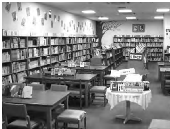
写真1 図書館では、学校図書館司書を中心に図書の並べ方や書籍の紹介、室内レイアウトなどを工夫して生徒の活用を促している。年間利用者は3年間で、延べ1万2000人から1万6000人に増えた

「膨大な本や資料の中から 「調べ込む経験」も大切 ③学校図書館の活用 学校図書館の利用は、同校が最も力を入れ る取り組みの1つだ(写真1・2)。英語科で は、図書館で好きな本を選び、英語で紹介す る